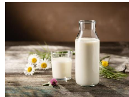
zadnja sreda v sept.-svetovni dan šolskega mleka