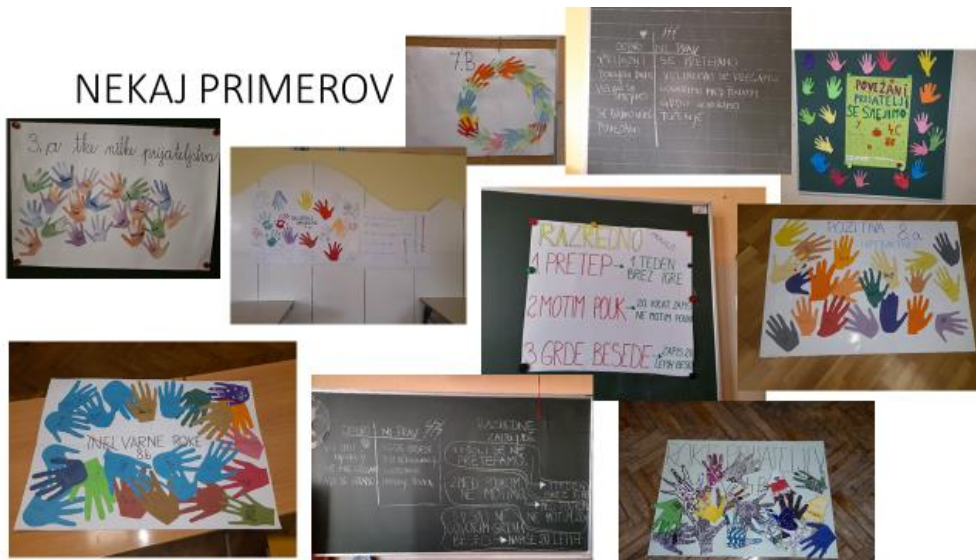
Slika 3: Primeri iz razredov

Zbrali smo trditve, ki so se ponavljale za kategorijo kaj je dobro in kaj ni prav. Trditve bodo predstavljale povedi, ki bodo zapisane v uokvirjenih slikah na hodnikih šole. Trditve, ki zaznamujejo pravo vedenje bodo zapisane na skupnem plakatu v avli šole. Številke predstavljajo trditve zastopane v posameznih razredih. Trditve bodo vsakodnevno spomnile učence, da so jih oblikovali sami znotraj svojih razredov in skupaj s svojimi sošolci in prijatelji. Nekatere bodo zapisane tudi na stopnicah avle šolskega hodnika. Le aktivna vloga vsakega posameznika pri uvajanju nove oblike dela lahko privede do spremembe, ki učinkuje v širši skupnosti učencev in delavcev šole.