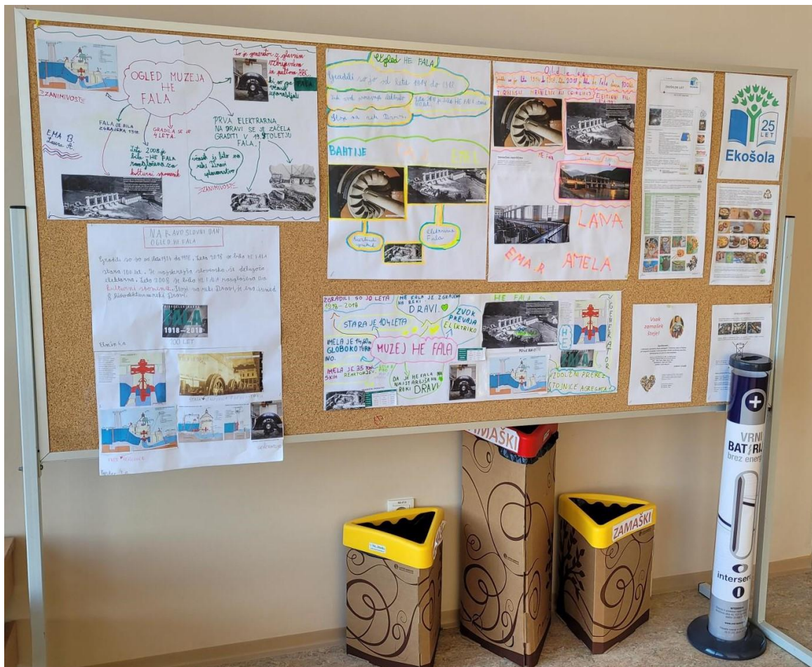
Šolski Eko kotiček

Prav tako izkušnje kažejo, da so učenci vajeni takšnega načina dela. Postanejo veliko boljši bralci in uspešnejši raziskovalci v višjih oddelkih. So bolj motivirani za raziskovalno delo, uspešneje postavljajo raziskovalna vprašanja in iščejo ugotovitve. Knjižnica jim ni tuj prostor, knjige jih ne odvrnejo. Najbrž imamo zaradi takšnega pristopa veliko število učencev, ki želijo sodelovati pri raziskovalnih nalogah. Tudi zato smo že vrsto let naj šola v okviru programa Mladi za napredek Maribora v Mestni občini Maribor.