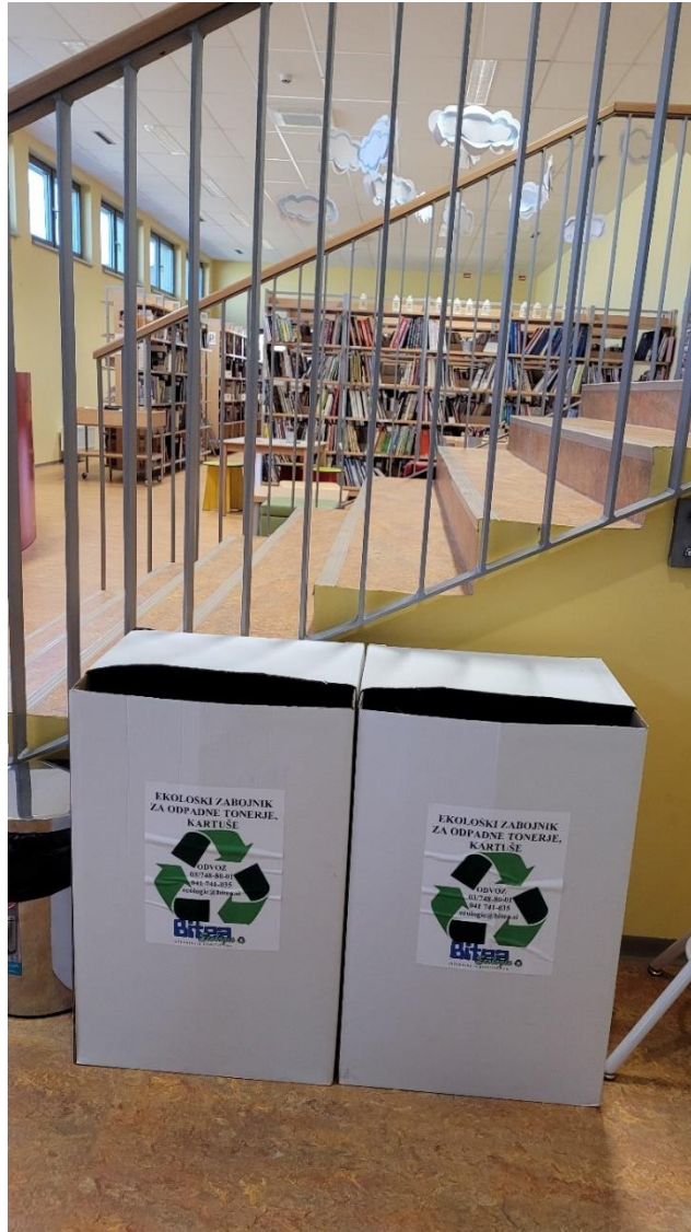
Eko zabojniki za zbiranje odpadnih kartuš in tonerjev.

Razred, v katerem je največ učencev opravilo Eko bralno značko, je tudi ustrezno nagrajen na zaključni prireditvi Bralne značke, ki jo organiziramo v mesecu maju. Učenci, ki so pohvaljeni pred vsemi udeleženci, so ponosni na dosežek in tudi dodatno motivirani za prihodnje aktivnosti.