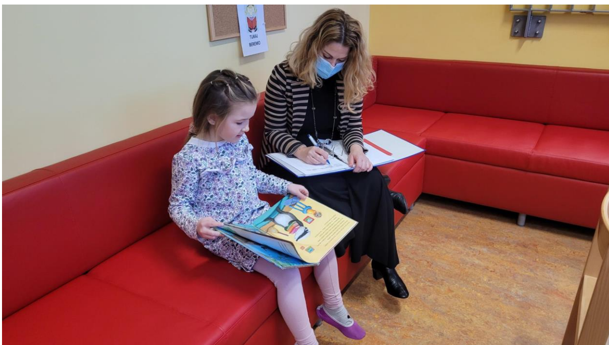
Knjižničarka vodi evidenco opravljene Eko bralne značke.

Pri dejavnosti je pomembno tudi sodelovanje staršev, saj bi se naj učenec o sporočilu prebranega doma pogovoril s starši in ponotranjil pridobljene informacije. Tako tudi starše spodbujamo k ekološkemu vedenju in ekosocializaciji.