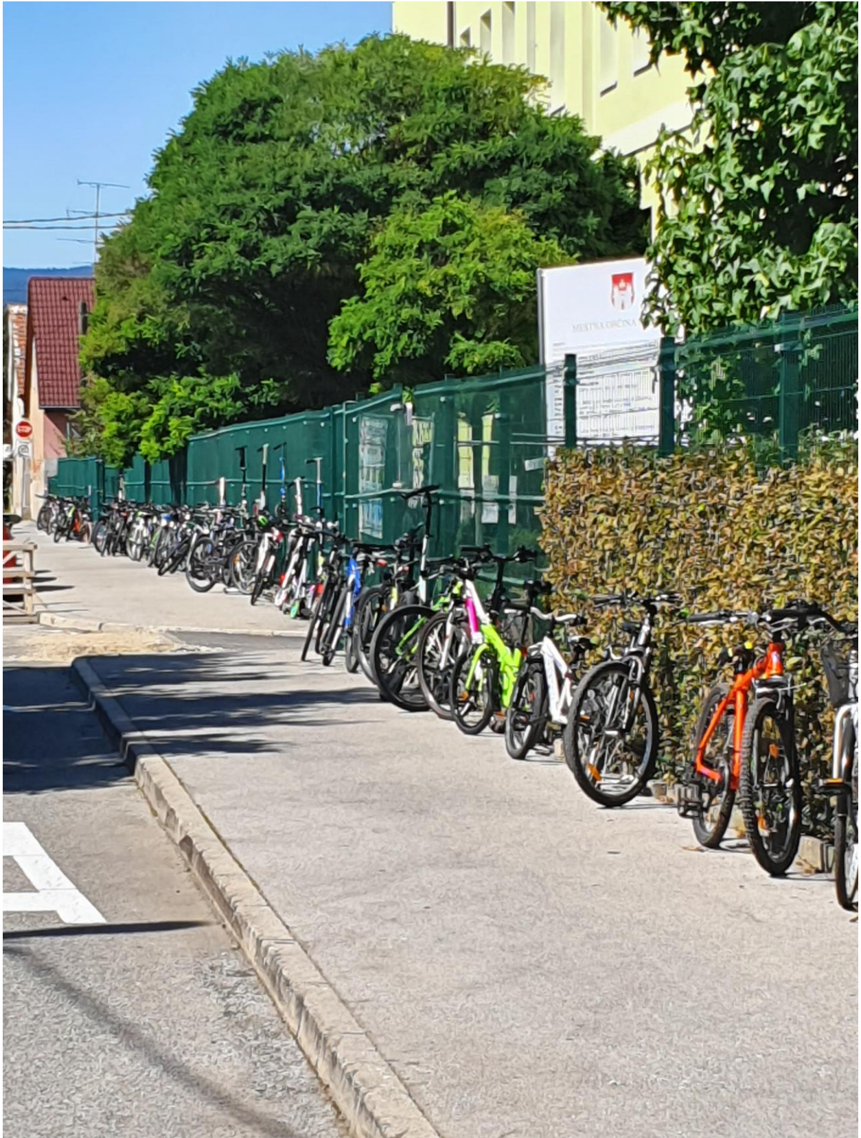
Otroci se množično vozijo v šolo