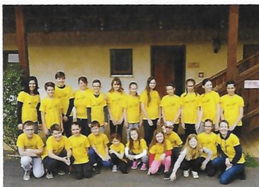
Padežnikovci raziskujemo netopirje na vulkanu

Za dvajset učencev naše šole je bila najbolj zanimiva aktivnost tridnevna mobilnost v avstrijskem kraju Tieschen (april, 2019). Skupaj z učenci partnerskih šol ter otroki iz partnerskih vrtcev so učenci aktivno sodelovali