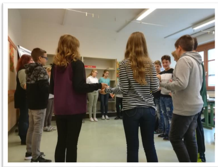
Zapisala: Stanka Emeršič vodja šolske projektne skupine