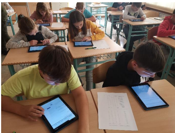
reševanje spletne ankete za projekt JeŠT