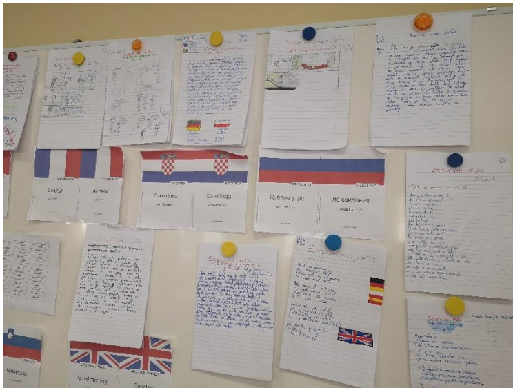
Učenci so pridno ustvarjali; nastali eseji, stripi