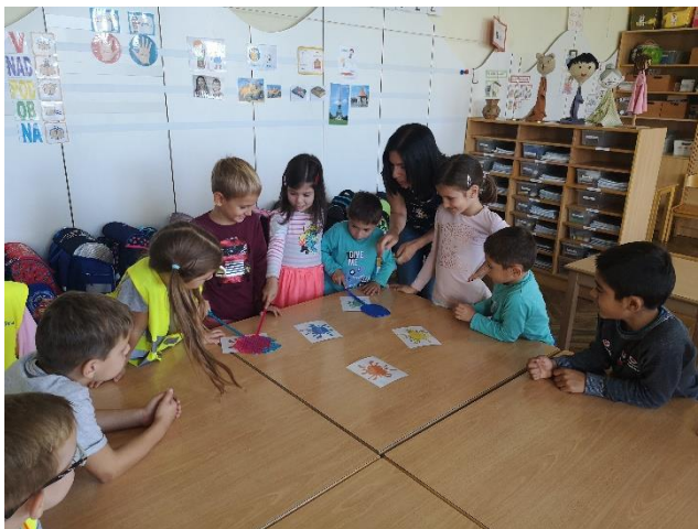
prvošolci se učijo angleško in nemško