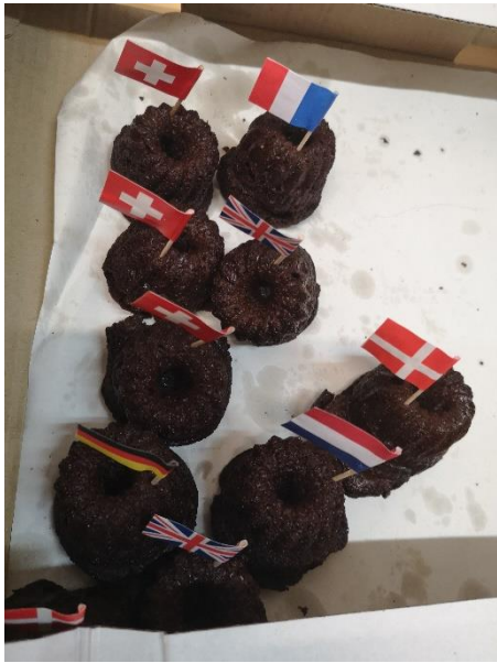
Sladka »nagrada« za vse pedagoške delavce, ki so vodili dejavnosti