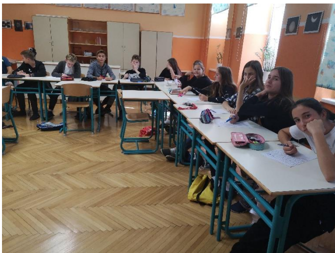
Osmošolci pišejo esej na temo