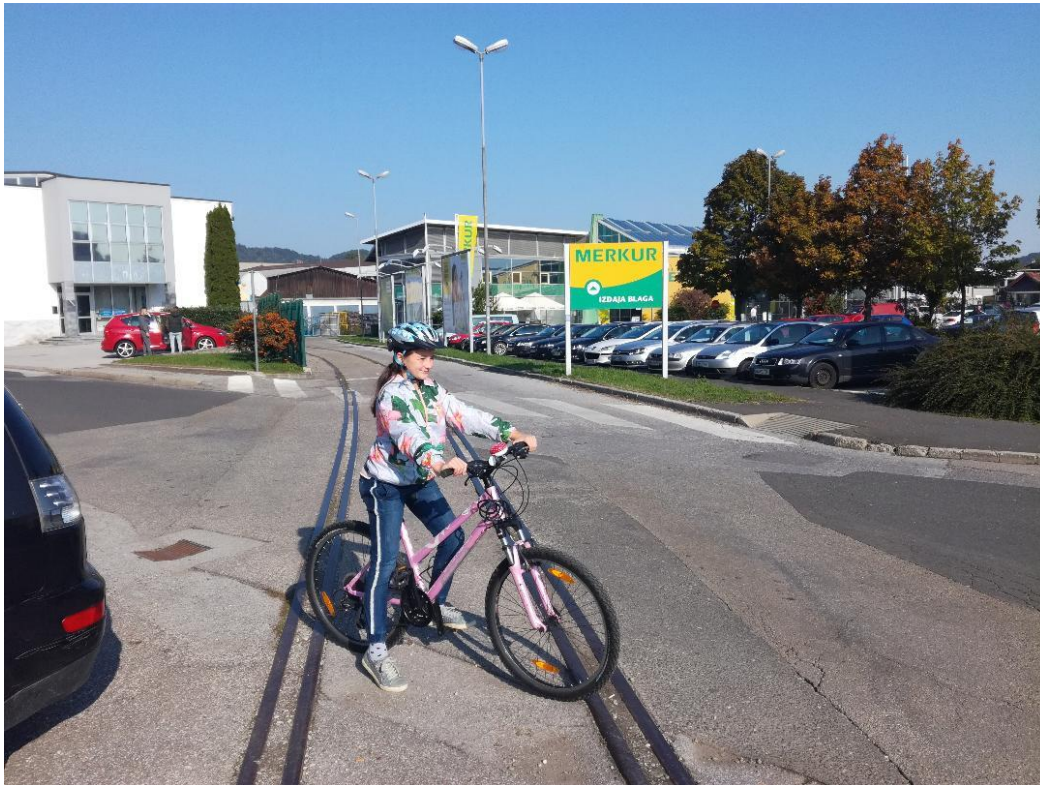
b) PREHOD ŽELEZNIŠKIH TIROV, KI NISO VEČ V UPORABI JE MOTEČ IN NEVAREN ZARADI ZDRSA. ZELO NEVARNO, KO JE MOKRO.