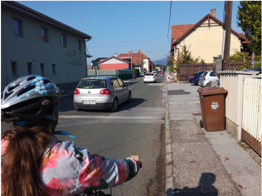
c) NI STEZE ZA KOLESARJE NITI KOLESARSKEGA PASU V CELOTNI DOLŽINI ULICE