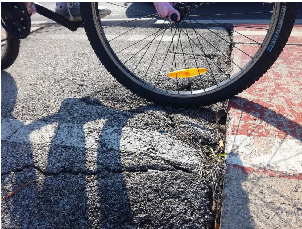
Nevaren prehod na nadvoz na kolesarski stezi (poškodovana kolesarska steza)