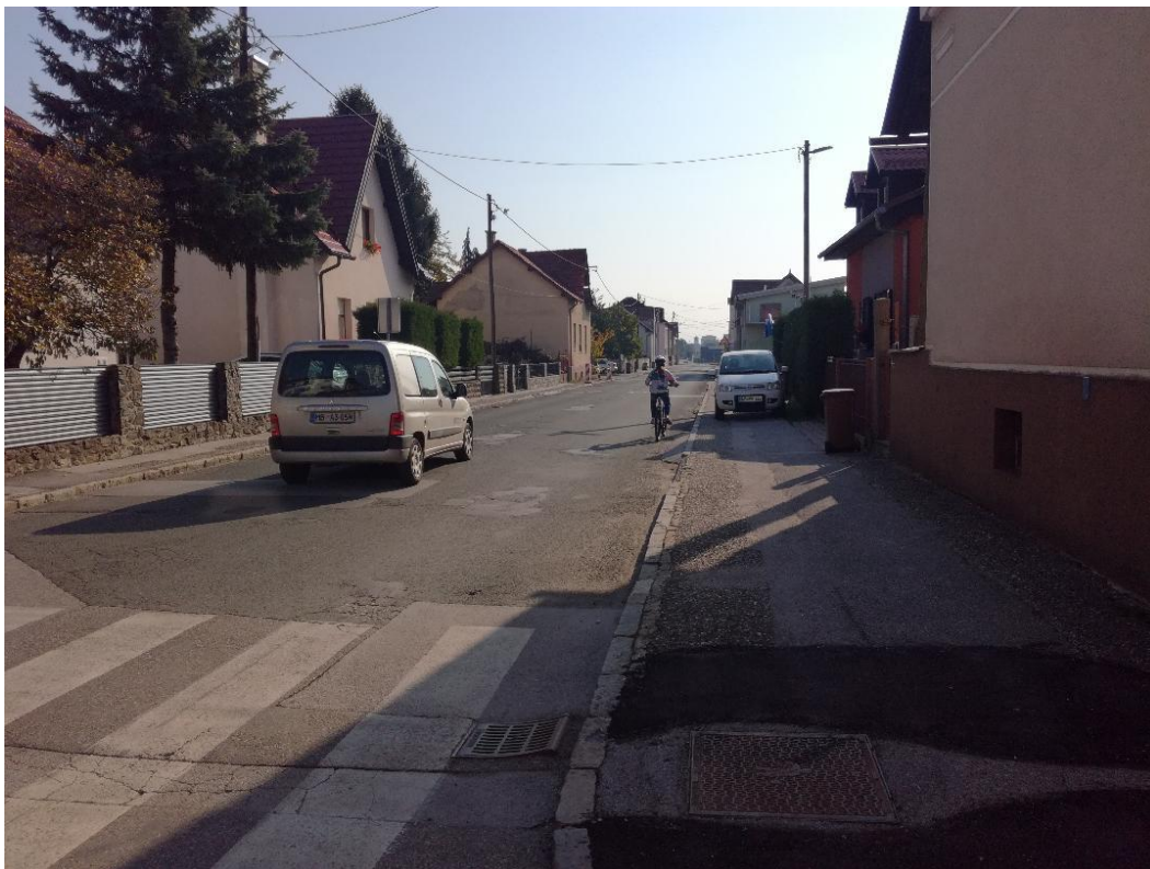
c) NI STEZE ZA KOLESARJE NITI KOLESARSKEGA PASU V CELOTNI DOLŽINI ULICE