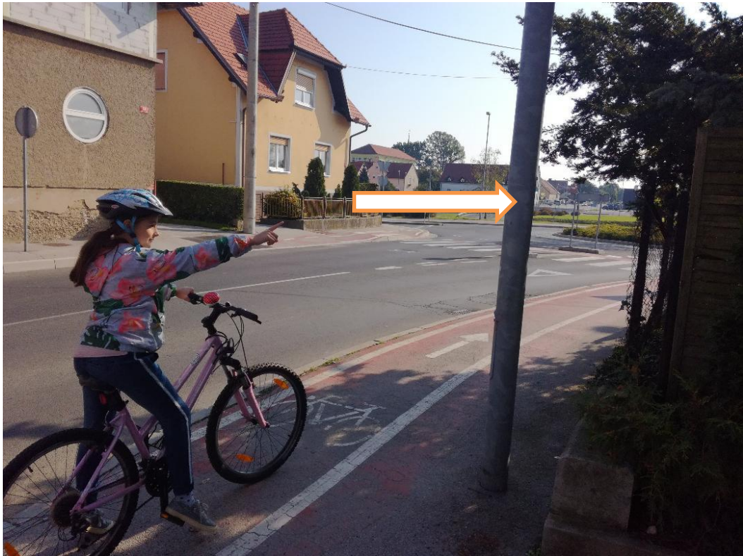
MESTO ZA PROMETNO OGLEDALO