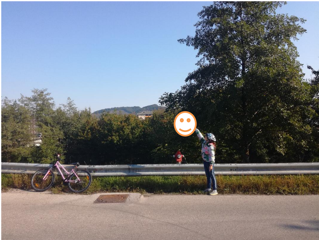
b) MANJKA PROMETNO OGLEDALO