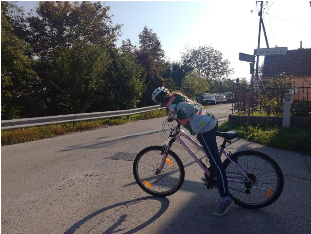
a) NEPREGLEDNO KRIŽIŠČE