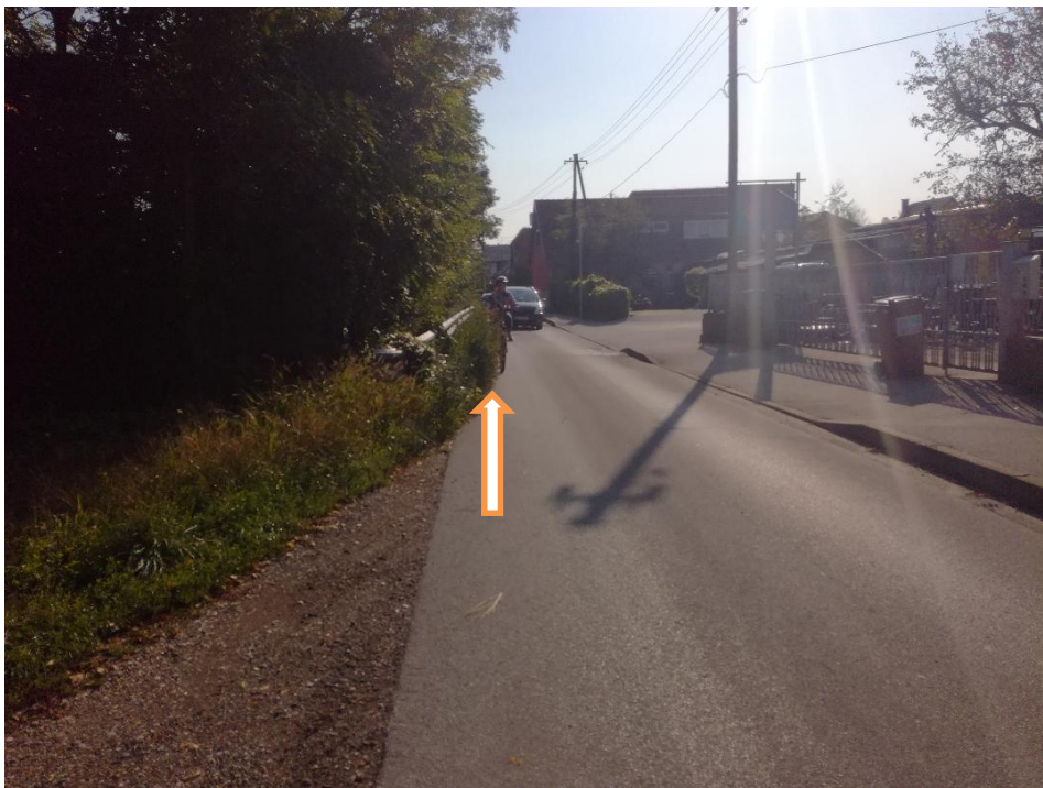
b) REDNO VZDRŽEVANJE CESTIŠČA (KOŠNJA TRAVE IN VEJ). OVIRAJO VARNO KOLESARJENJE OB SREČANJU Z AVTOMOBILOM.